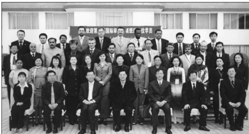
Les participants au Programme international de formation en contrôle

grande partie satisfaisantes et qu'aucune irrégularité d'importance majeure n'avait été détectée. Les ministères de la planification, des affaires civiles, des finances et du contrôle ont appliqué des mesures de gestion des fonds efficaces et des procédures de surveillance appropriées afin d'utiliser les fonds de manière uniforme. Par contre, les contrôleurs ont fait part de problèmes dans certains ministères, dont l'affectation décentralisée des fonds, une affectation tardive des fonds, des procédures incomplètes pour l'encaissement des dons, ainsi que des retards en ce qui concerne les écritures comptables et l'inscription des dons dans des comptes spéciaux. Dès qu'ils ont été mis au courant de ces problèmes, les ministères visés ont rapidement pris des mesures rectificatives et ils ont réglé, dans l'ensemble, le problème des écritures comptables et de l'inscription dans des comptes spéciaux.