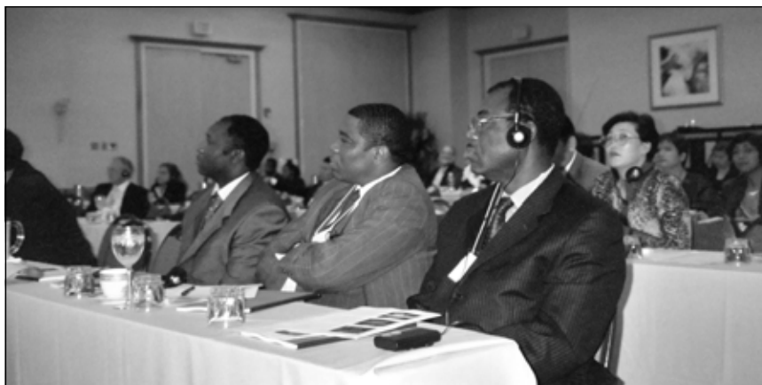
Délégation du Cameroun à la conférence du Consortium international pour la gestion des comptes publics à Miami