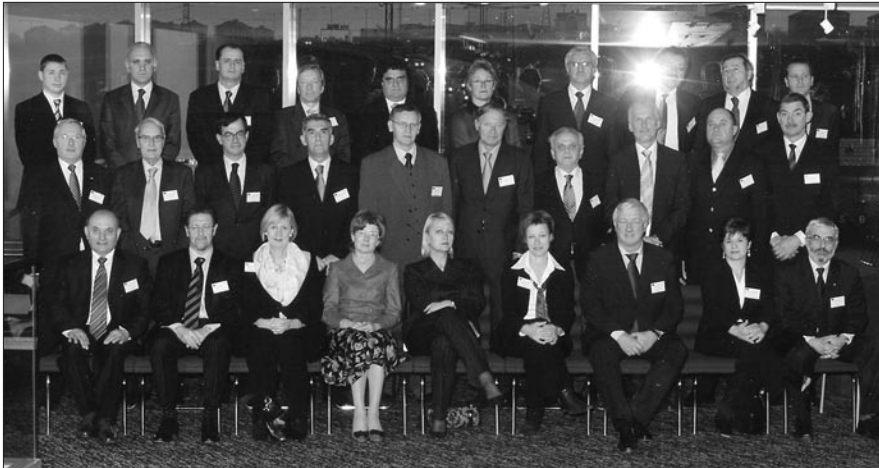
Les dirigeants des ISC de l'Union européenne après la réunion du Comité de contact en décembre 2005