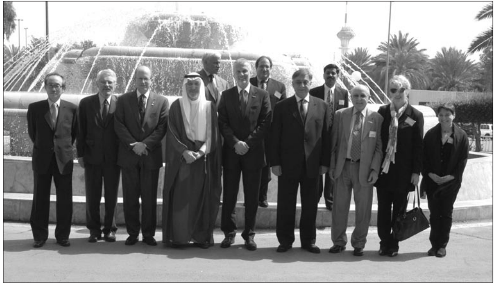
Les membres et le personnel de la Commission des affaires financières et administratives font une pause pour la photo de groupe au cours de la réunion de Riyad.

sont prêtes à l'utiliser. Par la même occasion, un certain nombre de délégués ont insisté sur le fait que toutes les ISC doivent être connectées à Internet.