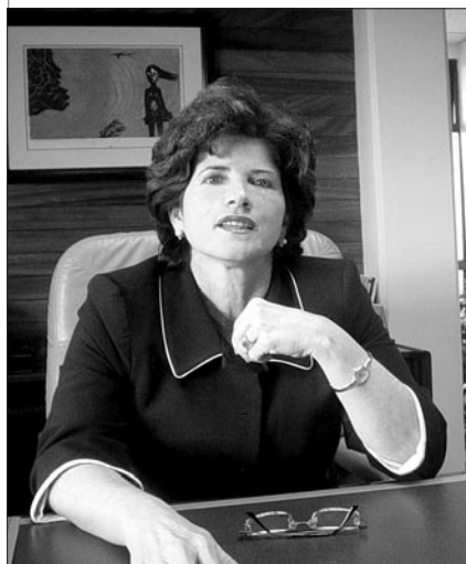
M me Rocío Aguilar

M me Rocío Aguilar a été nommée Contrôleure générale du Costa Rica. C'est la première femme à occuper de telles fonctions. Pour répondre aux besoins du futur, elle souhaite apporter des changements importants à l'organisation de l'ISC costaricaine. Ses priorités consisteront à renforcer le rôle des contrôles internes, à établir