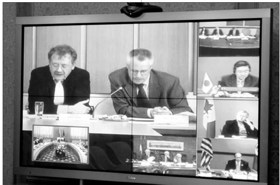
Die Teilnehmer der Videokonferenz der ORKB der G8-Länder vom Juni 2006.

Eine kürzlich durchgeführte Peer Review ergab, dass die Eidgenössische Finanzkontrolle (EFK) ihre Tätigkeit professionell,