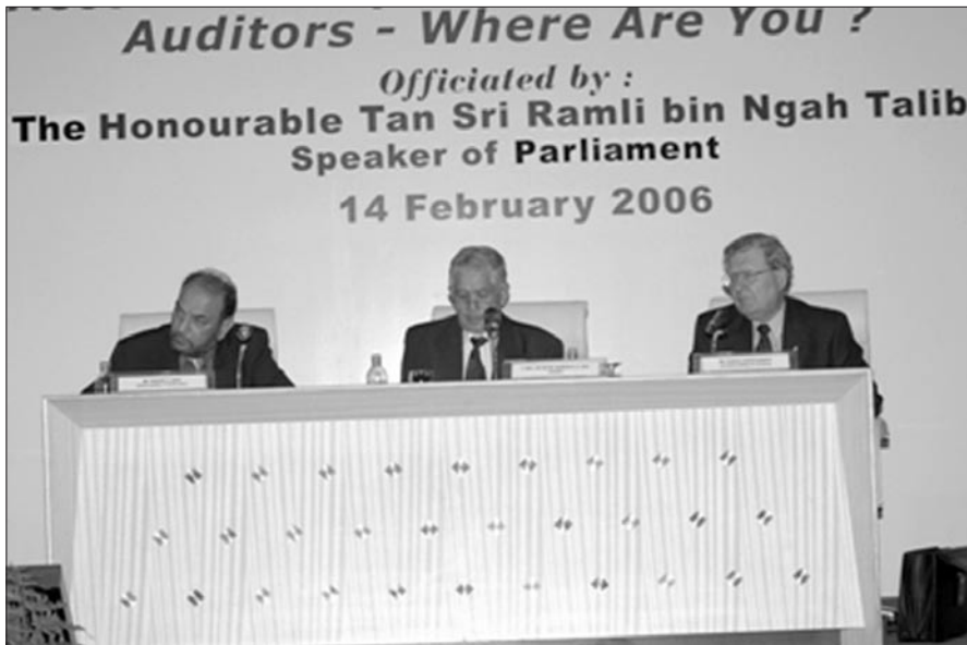
Vortragende auf der Fachtagung für Finanzkontrolle in Malaysia.

Prüfungsbeamten und den öffentlichen Erwartungen im Hinblick auf Rechenschaftspflicht und gute Verwaltungsführung.