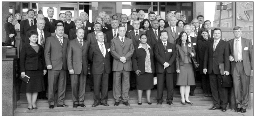
Delegierte auf der Tagung der Task Force Bekämpfung der internationalen Geldwäsche.