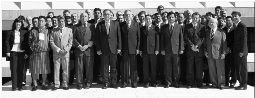
Delegierte auf der Tagung des Komitees für IT-Prüfung im Mai 2006 in Brasilia.

Das Komitee beschloss eine Reihe neuer Projekte über IT-Governance, e-Government Risiken, IT-Instrumente für elektronische Prüfungsunterlagen, die Anwendung der SAP Software in der öffentlichen Verwaltung und die Prüfung von Anwendungs-/Softwareentwicklung. Das Komitee legte außerdem fest, dass die 16. Tagung des Komitees für IT-Prüfung im März 2007 im Oman und die 17. Tagung 2008 in Japan stattfinden wird. Das 5. Seminar über Wirtschaftlichkeitsprüfung mit dem Thema IT-Governance wird vor der 16. Tagung stattfinden und wird von der ORKB der Vereinigten Staaten koordiniert.