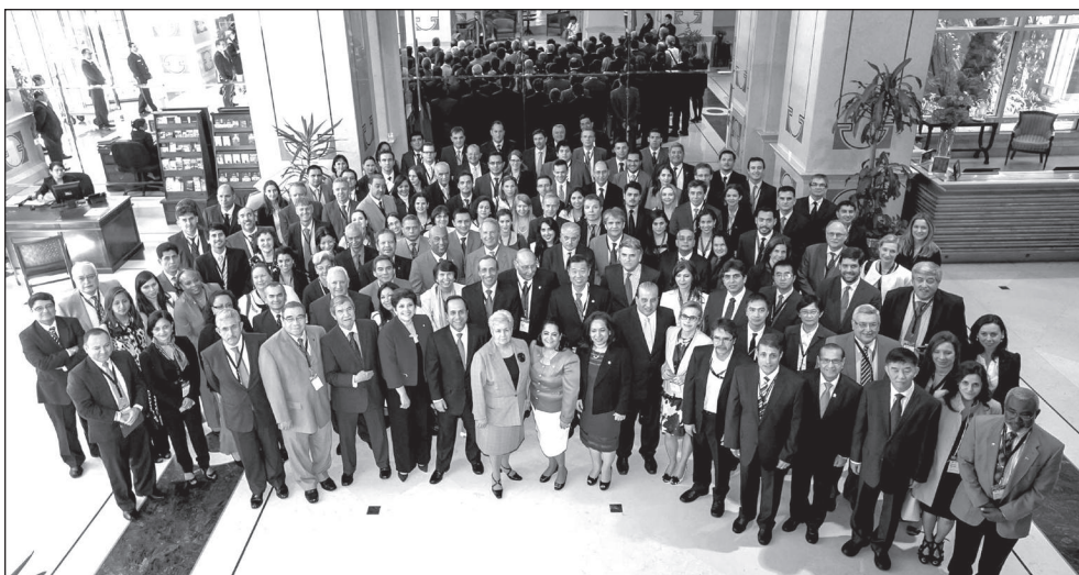
Los participantes en la XXIII Asamblea de la OLACEFS, celebrada en Chile en diciembre del año 2013, posan para la fotografía oficial.

Desde el 8 hasta el 11 de diciembre del año 2013, la Organización Latinoamericana y del Caribe de Entidades Fiscalizadoras Superiores (OLACEFS) celebró su XXIII Asamblea General en Santiago de Chile, auspiciada por la Contraloría General de la República de Chile. La Asamblea atrajo delegados de Argentina, Bolivia, Brasil, Colombia, Costa Rica, Cuba, República Dominicana, Ecuador, El Salvador, Guatemala, Honduras, México, Nicaragua, Panamá, Paraguay, Perú, Puerto Rico y Uruguay. Entre otros participantes había delegados de la Secretaría de la INTOSAI (Austria), el presidente del Comité Directivo de la INTOSAI (China), la Iniciativa para el Desarrollo de la INTOSAI (Venezuela); el Comité de Creación de Capacidades de la INTOSAI (Sudáfrica), la AFROSAI (Camerún), las Islas Caimán, Taipéi Chino, la Unión Europea, Francia, Alemania, el Banco Interamericano de Desarrollo, la Organización para la Cooperación y el Desarrollo Económicos (OECD), Portugal, España, Surinam, y la Oficina de las Naciones Unidas Contra la Droga y el Delito.