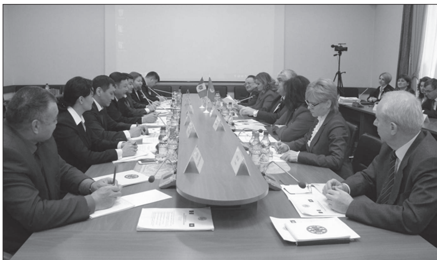
La delegación de Kirguistán (izquierda) y la Gerencia del CoA (derecha) se reunieron en enero del año 2014, a fin de abordar asuntos relativos al intercambio de experiencia.