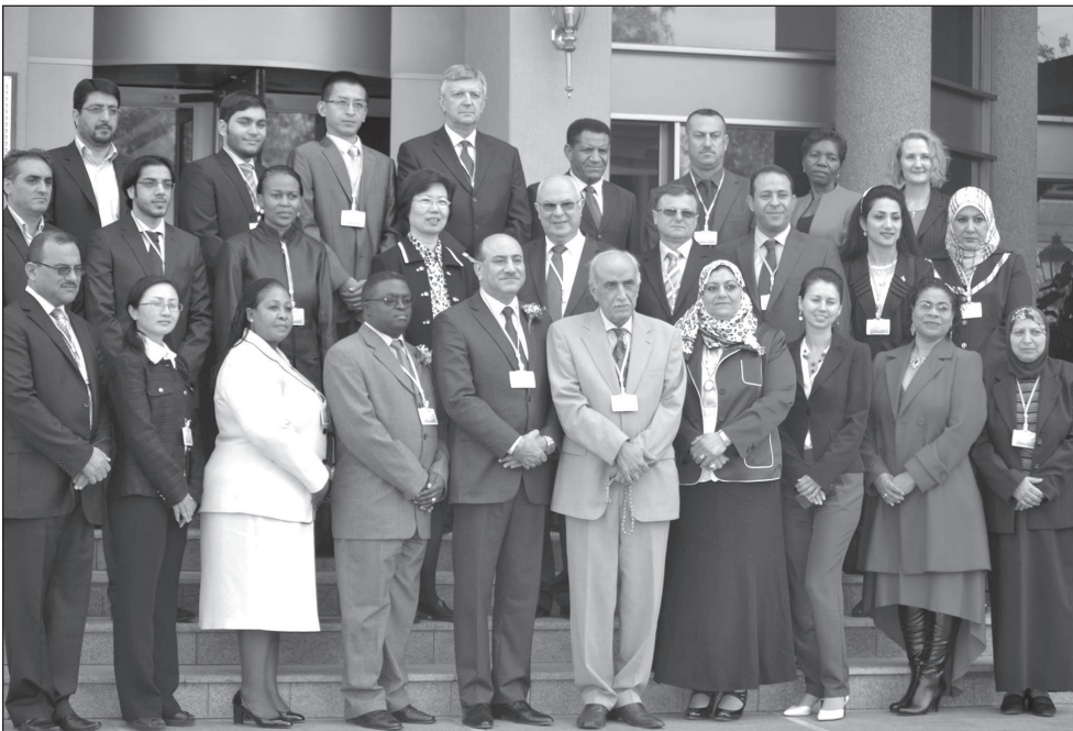
Los miembros asistentes a la VII Reunión del WGFACML, celebrada entre los días 17 y 19 de junio de 2013 en Windhoek (Namibia).