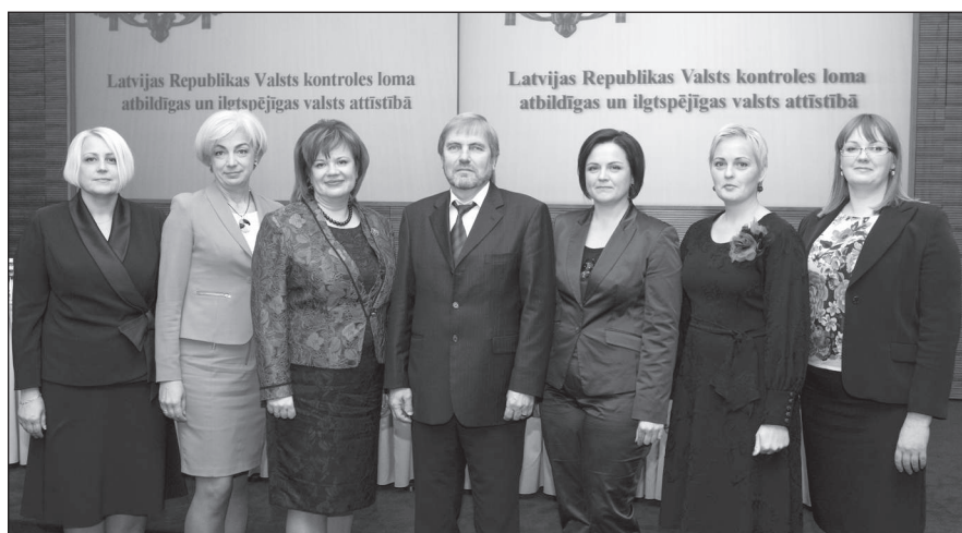
El Consejo de la Oficina de Auditoría del Estado de la República de Letonia se reúne en la conferencia celebrada el 4 de noviembre del año 2013.

Si desea obtener información adicional, puede ponerse en contacto con la Oficina de Auditoría del Estado en: