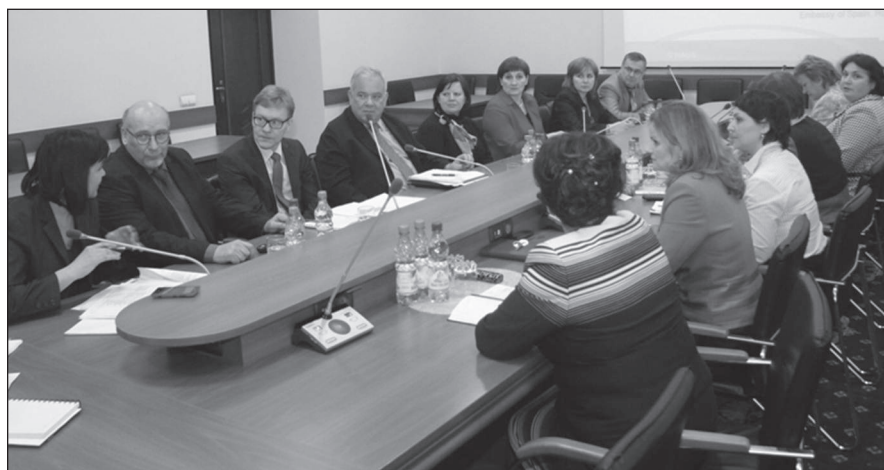
El Consorcio de Socios Hermanados y el Grupo de Trabajo Hermanado del CoA, en el taller realizado en enero del año 2014.

El objetivo general del proyecto se relaciona con el mejoramiento de responsabilidades y la administración de los fondos públicos en la República de Moldavia, mediante la consolidación y el fortalecimiento de la auditoría pública externa, de acuerdo con las normas internacionales de auditoría y las mejores experiencias de Europa en esta materia.