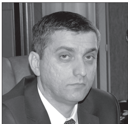
Vugar Tapdiq oglu Gulmammadov

La República de Azerbaiyán eligió a Vugar Tapdiq oglu Gulmammadov para desempeñarse como nuevo presidente de su Cámara de Cuentas. El señor Gulmammadov, quien es casado y tiene tres hijos, nació en Baku y se graduó en el año 1993 en la Facultad de Economía y Gerencia de la Producción del Instituto Económico del Estado de Azerbaiyán.