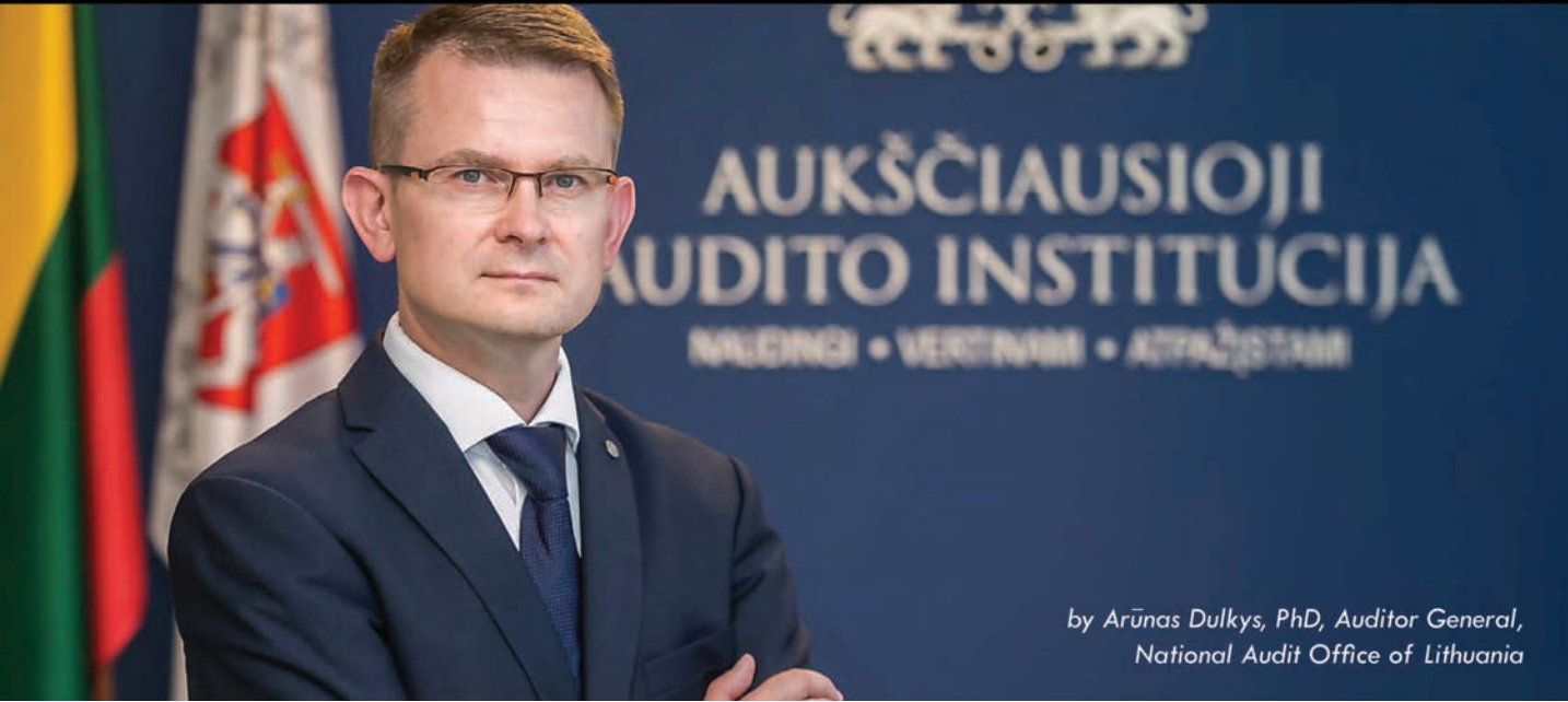
by Arūnas Dulkys, PhD, Auditor General, National Audit Office of Lithuania