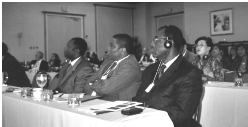
La delegación de Camerún estuvo presente en la conferencia ICGFM de Miami