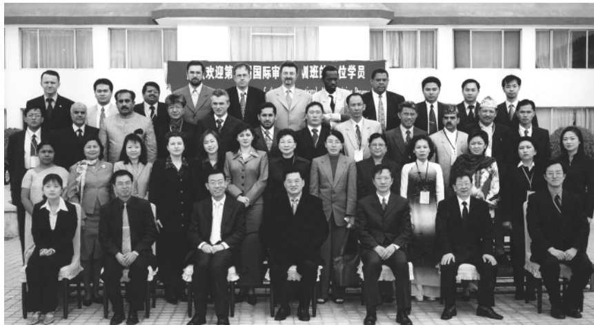
Los participantes en el Programa de Capacitación en Auditoría Internacional en China

cuatro participantes de 23 países de Asia y África, y de las regiones administrativas especiales de Hong Kong y Macao de China, fueron invitados a participar en este programa. El señor Li Jinhua - Auditor General de China- le dio la bienvenida al grupo de participantes y, el 6 de abril presidió la ceremonia de apertura del programa. El programa consta de dos segmentos. En el primero, realizado en el bien equipado Centro de Capacitación de Huairou de la CNAO, se ofrecieron 11 cursos intensivos sobre tópicos que abarcaban desde el sistema legal de auditoría en China hasta la auditoría del ambiente y de gestión. En la segunda mitad del programa, hubo que dividir el grupo de participantes para visitar algunas de las oficinas residentes de auditoría de la CNAO en Shanghai, Nanjing, Chongqing, Kunming y Guangzhou. Allí tuvieron oportunidad de observar auditorías de campo y de intercambiar ideas con sus colegas chinos.