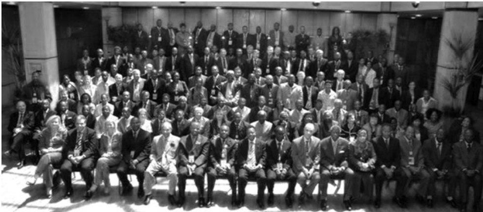
Los participantes en la XI Asamblea General de la AFROSAI.

La Organización de Entidades Fiscalizadoras Superiores de África (AFROSAI) celebró su undécima Asamblea General en Pretoria (África del Sur), desde el 13 hasta el 17 de octubre del año 2008. Auspiciada por la Auditoría General de África del Sur, la asamblea atrajo delegados de las EFS anglohablantes (la AFROSAI-E), las EFS francófonas (la AFROSAI-F), las EFS árabe hablantes (AFROSAI-A) y las EFS de habla portuguesa. Más de 50 países enviaron delegados, observadores o ambos. La nómina de países participantes incluyó a Argelia, Angola, Austria, Benín, Burkina Faso, Botswana, Burundi, Camerún, Canadá, Cabo Verde, República Centroafricana, Chad, Costa de Marfil, Djibouti, República Democrática del Congo, Egipto, Guinea Ecuatorial, Eritrea, Etiopía, Gabón, Gambia, Alemania, Ghana, Guinea-Bissau, Kenya, Lesotho, Liberia, Libia, Madagascar, Malawi, Mali, Mauritania, Marruecos, Mozambique, Namibia, Noruega, Polonia, Rwanda, Sao Tome y Príncipe, Senegal, Seychelles, Swazilandia, Suecia, África del Sur, Sudán, Tanzania, Togo, Túnez, Uganda, el Reino Unido, Zambia, y Zimbabwe. Entre los huéspedes y observadores se encontraban funcionarios y representantes ministeriales de la Secretaría de la INTOSAI, la Iniciativa para el Desarrollo de la INTOSAI (IDI), de la revista de la INTOSAI, del Instituto de Auditores Internos, y diversas organizaciones donantes internacionales.