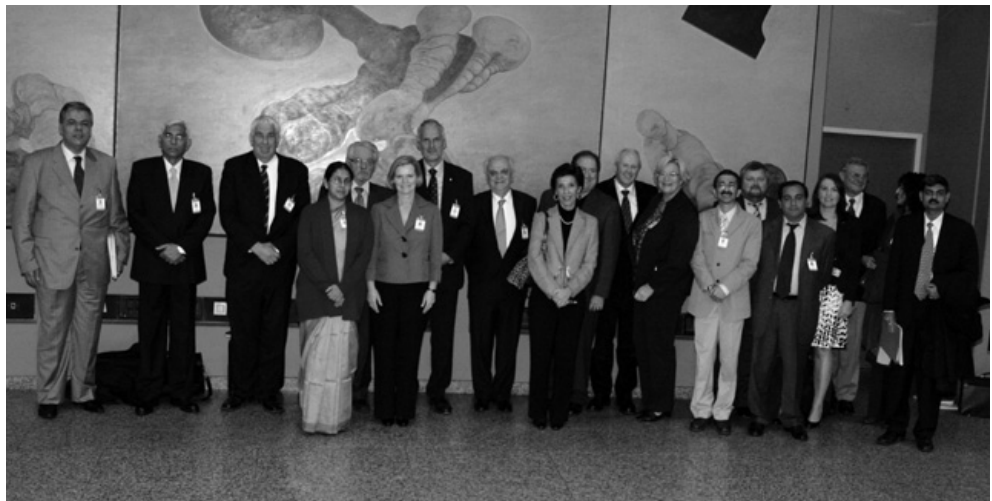
Los participantes en la primera reunión del task force de la Estrategia de Comunicaciones de la INTOSAI.

Estos objetivos habrán de lograrse mediante varias actividades: 1) comunicarles a todos los miembros los asuntos y temas relativos al trabajo de la INTOSAI; 2) incluir a expertos; 3) considerar las necesidades regionales y 4) identificar como un todo el valor agregado de las EFS individuales, así como de la INTOSAI. Al hacerlo, la INTOSAI promoverá un mayor entendimiento, hará que la información profesional -tales como las Normas Internacionales para las Entidades Fiscalizadoras Superiores (ISSAI)- esté a la disposición del público en general, y se comunicará abiertamente con los medios y otras partes interesadas. En consecuencia, la INTOSAI no sólo actuará como una organización modelo, también será más visible su rol de socio activo, internacional y reconocido, en todos los asuntos relacionados con la auditoría gubernamental.